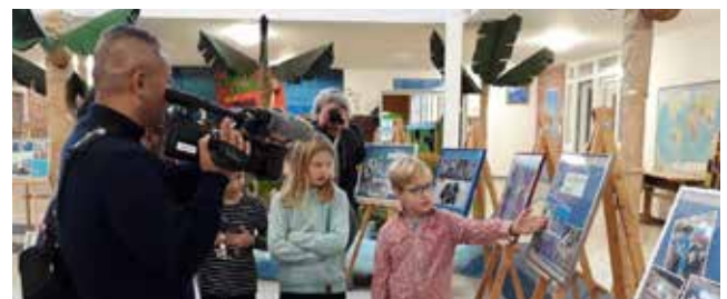
Grundschule Neuhaus (Oste): Schüler setzen sich für weniger Plastik ein.

Dass man auch als neue Nachhaltigkeitsschule viel bewirken kann, zeigt die Grundschule Neuhaus an der Oste, die 2019 den Förderpreis „Verein(t) für gute Kita und Schule“ der Stiftung Bildung für ihr Engagement in Umwelt- und Sozialprojekten gewann. Ein großes Anliegen ist die „Plastikfreie Schule“. Die Schülerinnen und Schüler entwickelten u. a. eine Wanderausstellung zum Thema und machten mit dem Musical „Müllpiratinnen / Müllpiraten“ auf Meeresverschmutzung sowie Lösungsmöglichkeiten aufmerksam. Diese Aktivitäten wurden sogar durch ein japanisches Fernsteam in einer preisgekrönten Dokumentation gewürdigt.