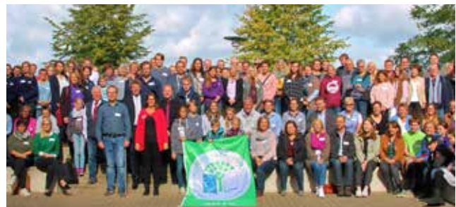
Ausgezeichnete Schulen 2019 am Hildegard-von-Bingen Gymnasium, Twistringen

Die Umweltscouts treffen sich regelmäßig unter Koordination der Projektleitung und beraten neue Projektideen, evaluieren vorhandene Projekte, entwickeln Möglichkeiten die Schule insgesamt nachhaltiger zu gestalten und beteiligen sich z.B. beratend bei Schul- oder Bauprojekten. Diese Ideen können dann über den Schülerrat oder den Schulvorstand eingebracht werden. So werden ganz nebenbei demokratische Strukturen und Prozesse etabliert und eingeübt. Wenn ein Projekt von der Entwicklung bis zum Ende umgesetzt worden ist, haben die Schülerinnen und Schüler ganz konkret eine wichtige Selbstwirksamkeitserfahrung erlebt.