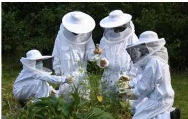
Imkern in Delmenhorst.

Viele der teilnehmenden Schulen setzen Projekte zum Handlungsfeld „Biologische Vielfalt“ um, indem sie ihre Schulhöfe, wie die Domschule Osnabrück, mit Hochbeeten oder mit neu angelegten Beeten ökologisch attraktiver gestalten, um die Artenvielfalt auf dem Schulgelände zu erhöhen. Zusätzlich werden an vielen Schulen Insektenhotels aufgestellt oder in Form einer Imker-AG mit der Haltung und Züchtung von Bienen begonnen.