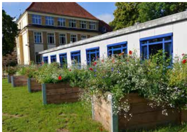
Hochbeete der Domschule Osnabrück.

Als ein Beispiel einer gelungenen Umsetzung kann an dieser Stelle die KGS Schinkel genannt werden, die bereits seit 1998 eine Vielzahl von langfristig angelegten fächerübergreifenden Projektthemen unter Einbindung der gesamten Schulgemeinschaft bearbeitet. Hierzu zählen Projekte zum Klimaschutz wie Energiesparen oder der CO 2 Reduktion beim Schultransport, Theaterprojekte zur Demokratiebildung, diese wurden mehrfach mit Friedenspreisen ausgezeichnet, nachhaltige Schülerfirmen oder Naturschutzprojekte (Insekten- und Krötenschutz).