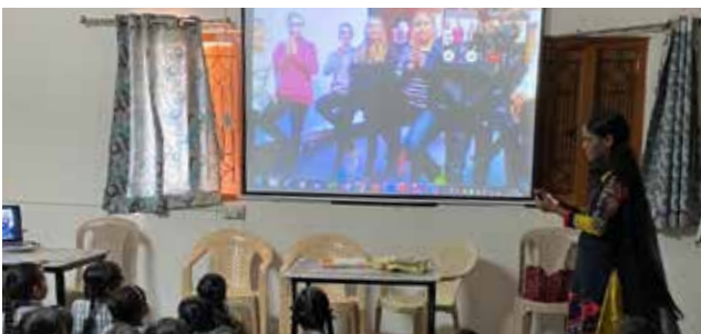
Seit 2009 als Umweltschule aktiv: die Grundschule Wingster Wald.

Die Grundschule am Wingster Wald ist bereits seit 2009 Umweltschule und legt als internationale Nachhaltigkeitsschule und Pilotschule „Gutes Leben für alle“ einen besonderen Fokus auf Nachhaltigkeitsthemen und Globales Lernen. Im aktuellen Projekt „Mera, deine, nuestro Future – unser Kompass von heute für die Welt von morgen“ tauschten sich Viertklässler mit Schülerinnen und Schülern aus Indien und Mexiko aus und formulierten Wünsche für ihre gemeinsame Zukunft auf unserem Planeten. Die Kinder stellten ihre Ergebnisse dem Bürgermeister der Gemeinde vor und schrieben einen gemeinsamen Brief an Entwicklungsminister Müller. Diese Herangehensweise steht beispielhaft für ein Lernen, das den Blick auf die Welt öffnet, Begegnungen auf Augenhöhe ermöglicht und konkrete Handlungsmöglichkeiten anbietet. Das Projekt überzeugte auch die Jury des Schulwettbewerbs zur Entwicklungspolitik. Bereits in den vergangenen Jahren wurde die Schule für ihren ganzheitlichen BNE-Ansatz mehrfach ausgezeichnet.